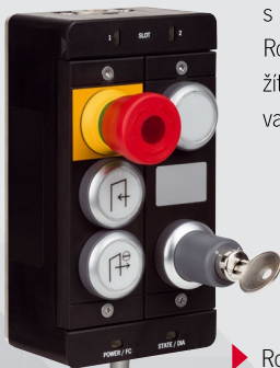
► Rozšiřující modul MCM

Lze je namontovat odděleně od vyhodnocovacího modulu s jistěním ochranného krytu MGB2 a od sběrnice modulu. Rozšiřující modul můžete ve spojení se sběrnice modulem využít k řešení svých individuálních požadavků i zcela bez vyhodnocovacího modulu s jistěním ochranného krytu a dveřní kliky.